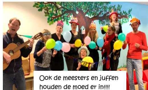
Ook de meesters en juffen houden de moed er in!!!!

We zien fantastische initiatieven (foto's en mailtjes) om de dag educatief en aangenaam door te komen.